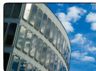
Palazzo Affari, sede degli uffici al pubblico