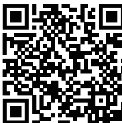
dal Progetto "What ISIS has Left Behind" di Marta Bellingeri & Alessio Mamo